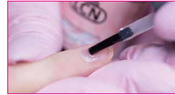
2) Dopo aver applicato uno strato sottilissimo di Natural Nail Boost Gel, lasciarlo indurire per 60 secondi sotto la lampada a LED o per 2 minuti nel dispositivo a tubi.