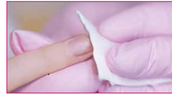
1) Sgrassare l'unghia naturale, darle forma limandola e pulire con il Natural Nail Boost Cleaner.