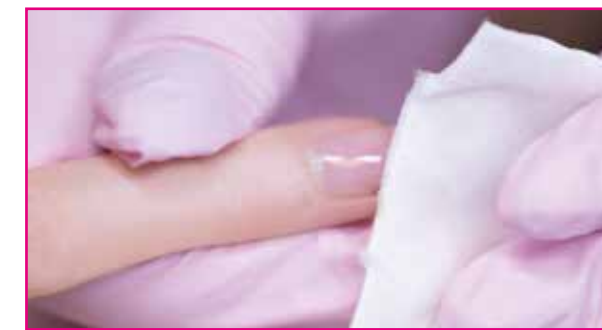
4) Successivamente pulire l'unghia con un tampone di cotone e, se necessario, laccare con un Nail Polish colorato. In alternativa l'unghia può essere lucidata donandole luminosità con il prodotto Natural Nail Boost Shine Finish. Consigli: non laccare immediatamente dopo l'applicazione di Natural Nail Boost in quanto il Nail Polish potrebbe non aderire bene a causa del trattamento finale oleoso.