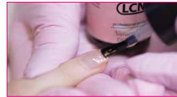
3) Ripetere questo procedimento.